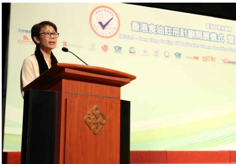
主禮嘉賓——環境局副局長陸恭蕙女士致辭。