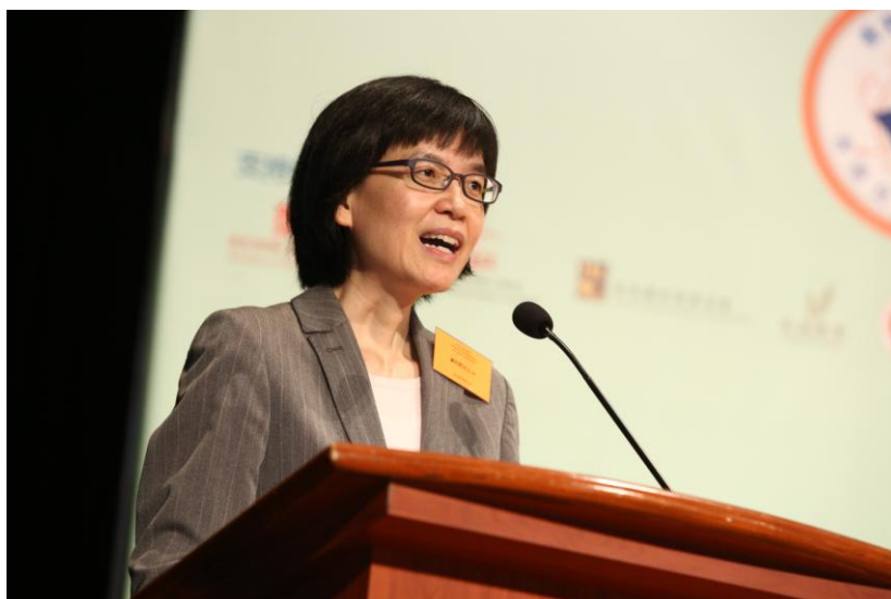
主禮嘉賓——食物環境衛生署署長劉利群女士致辭。