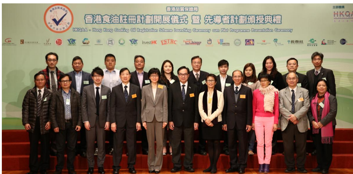
主禮嘉賓、香港品質保證局董事局成員及計劃的支持機構合照。