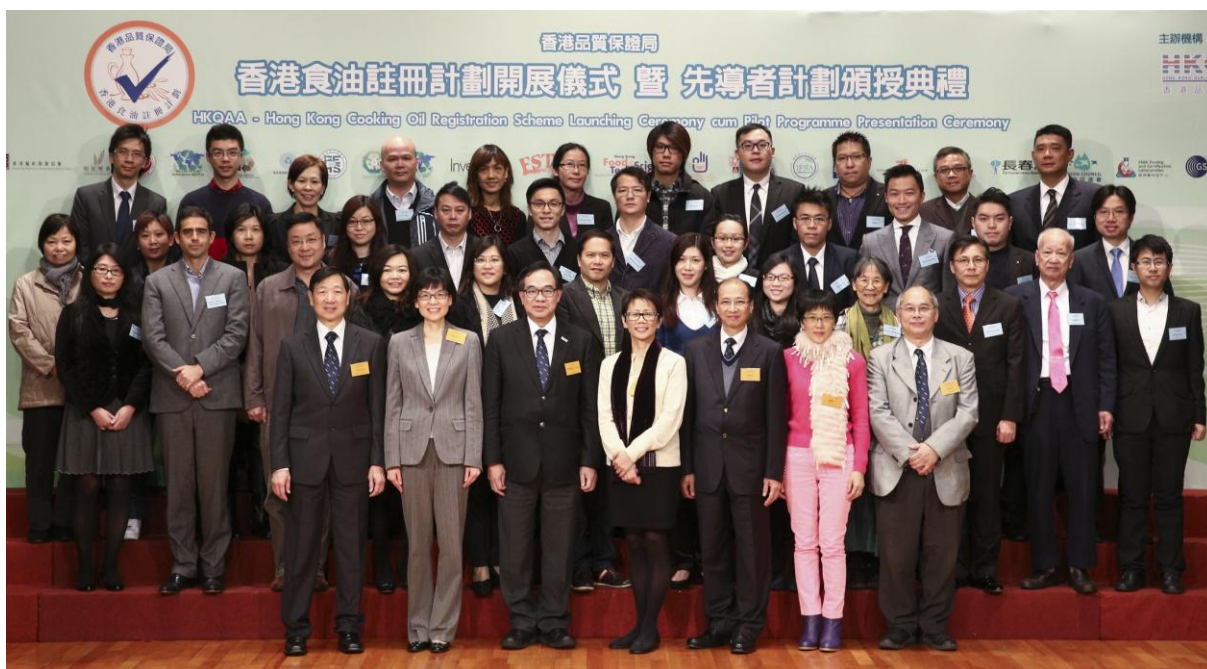
主禮嘉賓、香港品質保證局董事局成員、一眾註冊機構及「計劃同行者」大合照。