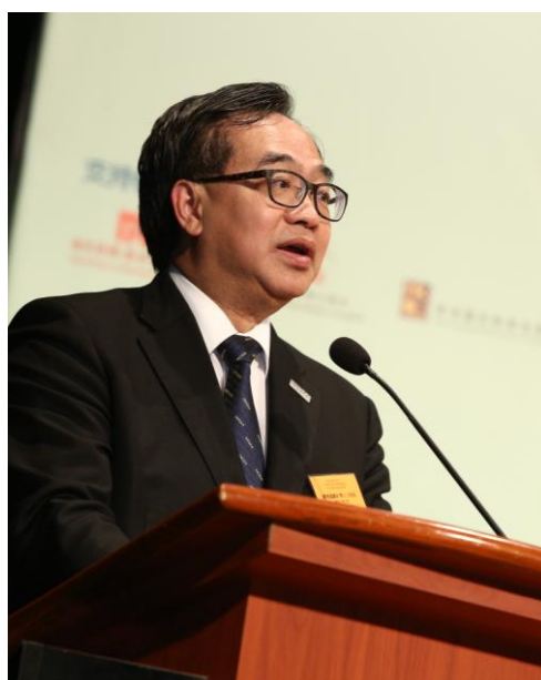
香港品質保證局主席盧偉國議員致歡迎辭。

香港品質保證局副主席何志誠工程師、食物環境衛生署署長劉利群女士、香港品質保證局主席盧偉國議員、環境局副局長陸恭蕙女士及香港品質保證局總裁林寶興博士(由左至右)主持「香港食油註冊計劃」開展儀式。